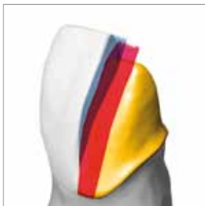
Technica a tre strati