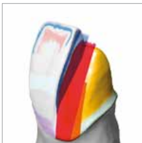
Técnica de capas profesional