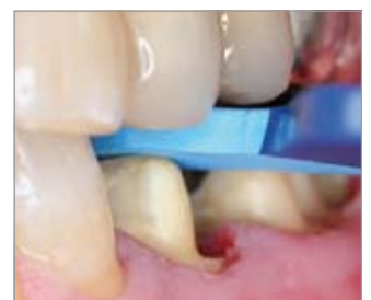
Imagen 9 Comprobación del espacio creado por medio de una mordida de prueba