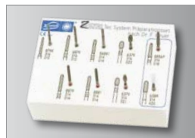
Imagen 4b Juego de preparación ZENOTEC según Dr. Beuer