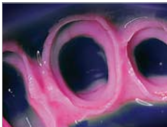
Imagen 18 Impresión; todos los contornos pueden reconocerse claramente