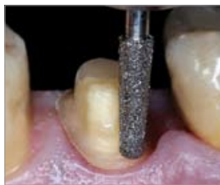
Imagen 5 Primer paso: Preparación previa con punta de diamante de grano grueso en la zona de dientes posteriores