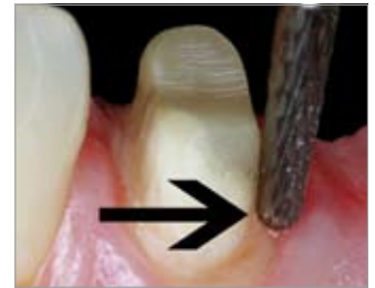
Imagen 13 Acabado del bisel pronunciado de forma particularmente segura y atraumática