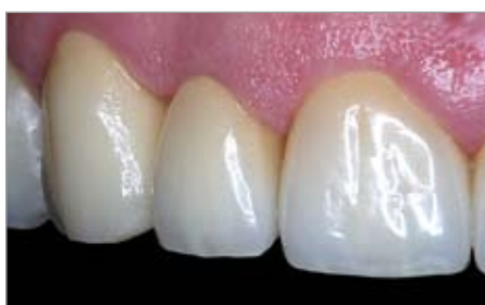
Imagen 1 Coronas anteriores ZENOTEC altamente estéticas; realización F. Wüstefeld, Hanóver/Alemania, maestro en prótesis dental