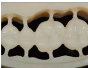
Imagen 20 Provisorio de PMMA confeccionado con el sistema ZENOTEC