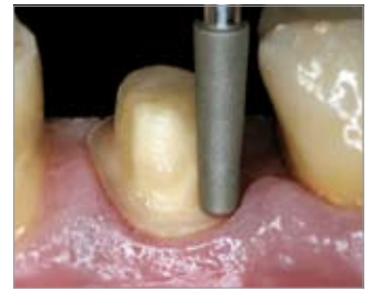
Imagen 11 Tercer paso: Punta de diamante de acabado cónica para molares