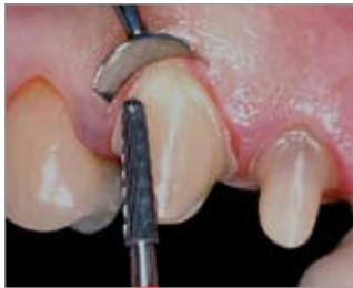
Imagen 12 Tercer paso: Fresa especial de acabado de carburo de tungsteno; ergonómica, para la zona de dientes anteriores y posteriores