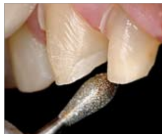
Imagen 7 Segundo paso: Reducción lingual en los dientes anteriores