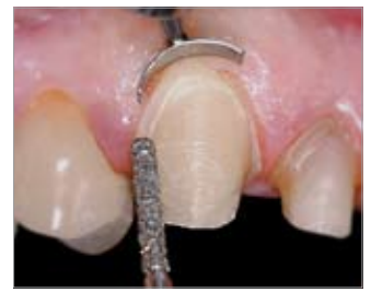
Imagen 6 Primer paso: Instrumento más fino para la zona de dientes anteriores, un bisel pronunciado facilitará todos los siguientes pasos de trabajo