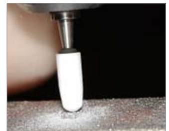
Imagen 15 Acabar la preparación y redondear todos los bordes