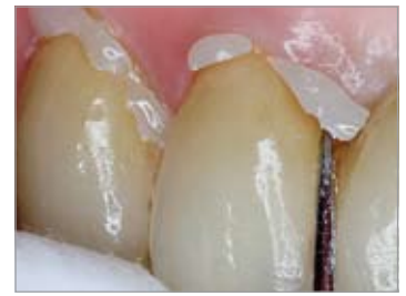
Imagen 21 Cementación con cemento dual; fácil eliminación de los excedentes

Visto en conjunto puede decirse que una restauración de óxido de circonio puede trepanarse o bien extraerse casi lo mismo de rápido que una restauración provista de una estructura compuesta de una aleación de metal no precioso.