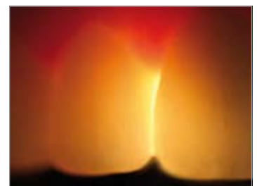
Imagen 22 Alta translucidez y transmisión luminosa que alcanza el surco y la gingiva