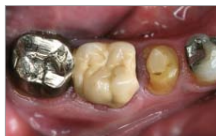
Imagen 2 Después del tratamiento: Coronas ZENOTEC después de la inserción