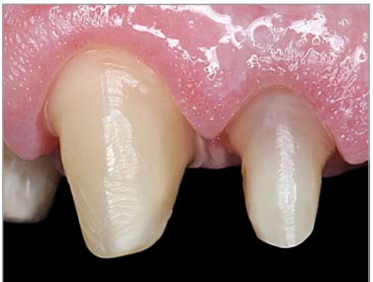
Imagen 16 Cuarto paso Preparación acabada