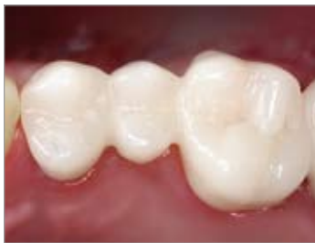
Imagen 19 Restauración provisional