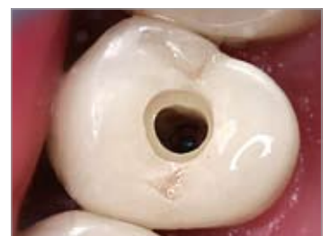
Imagen 23 Trepanación de una corona ZENOTEC; ¡cuide de disponer siempre de bastante refrigeración por agua!