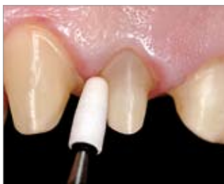
Imagen 14 Conformación individual de una punta abrasiva cerámica para casos especiales por medio de un diamante rectificador