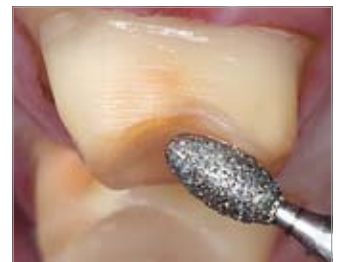
Imagen 8 Segundo paso: Reducción oclusal en los molares