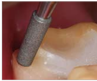
Imagen 10 Tercer paso: Punta abrasiva de acabado corta para coronas parciales y áreas difícilmente accesibles

Este instrumento de aplicación universal incluido en el juego ofrece – gracias a su dentado diferente en el vástago y en la punta – la posibilidad de acabar el hombro en una sola operación y de forma muy lisa y atraumática, así como de alisar las paredes dentarias confiriéndoles una ligera rugosidad predefinida. La punta finamente dentada girará muy suave y uniformemente sobre el hombro definido anteriormente durante la preparación previa, no dañándose la gingiva gracias al instrumento atraumático. El vástago, en cambio, dejará una estructura superficial óptima para la retención de la corona.