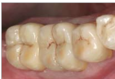
Imagen 3 Después del tratamiento: Coronas ZENOTEC después de la inserción

La mayor circunferencia del diente preparado se encuentra claramente visible en el área del límite de preparación gingival, no siendo importante si la preparación es realizada pronunciadamente en chamfer o bien con hombro y borde interior redondeado. En el margen debería alcanzarse una profundidad de corte circular uniforme de 1,0 mm.